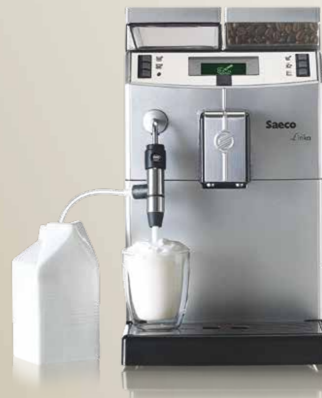
Cappuccinatore Siluro Lirika

Cappuccinatore Siluro in acciaio inox da applicare alla lancia vapore per l'erogazione di cremosi cappuccini e bevande latte. Può essere utilizzato anche in combinazione con il Milk Cooler.