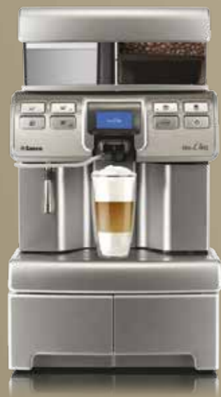
Aulika Top RI