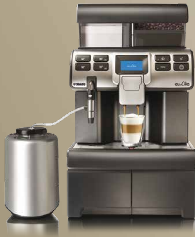
Base Aulika Mid

Base in metallo verniciato e ABS mat black, predisposto in family feeling con Aulika Mid, con 2 cassetti per riporre bustine di zucchero, palettine, ecc. Se ne consiglia l'abbinamento alla macchina se si utilizza il Milk Cooler o il refrigeratore Astra.