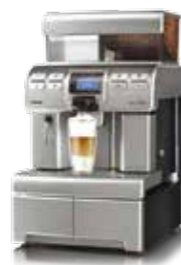
Aulika Top RI