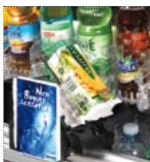
RIPIANI FACILMENTE ESTRAIBILI E SENZA COLLEGAMENTI ELETTRICI.