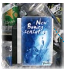
IL PRODOTTO VIENE SEMPRE SCARICATO NELLA CORRETTA POSIZIONE VERTICALE