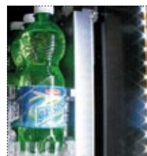
ILLUMINAZIONE A LED

Note: Le dimensioni di cui sopra sono solo di riferimento. Alcuni prodotti, anche se nelle dimensioni riportate, possono essere difficili da vendere a causa della loro forma. Si prega di eseguire test sui prodotti prima del riempimento della macchina.