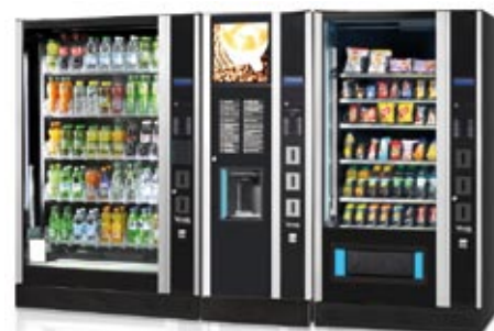
Linea "Design" completa