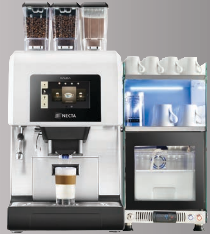
KALEA 2 ES + 1 IN + Frischmilch