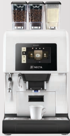
KALEA 2 ES + 1 IN (Milchpulver)